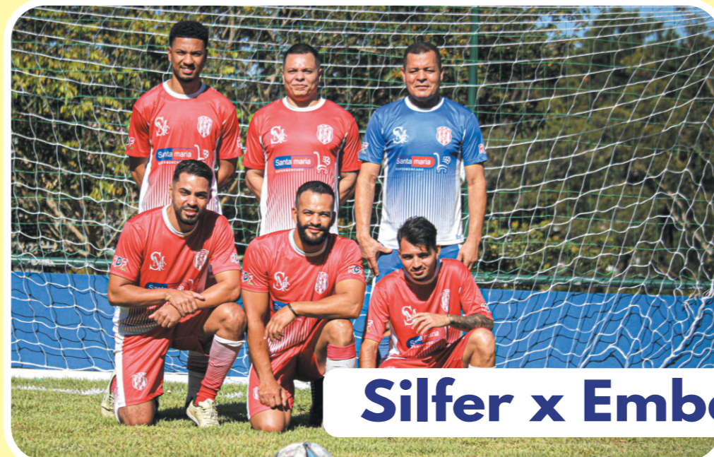
Silfer x Embalagens Mara