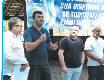
Prefeito Aladin de Mairiporã elogia o Sintrapel-SP pela iniciativa em benefício dos trabalhadores e da comunidade