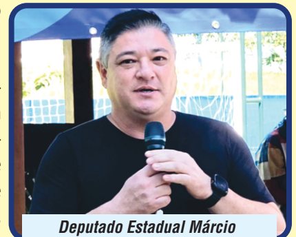
Deputado Estadual Márcio Nakashima reafirma parceria com a nossa categoria em Mairiporã

Além da atuação legislativa, o mandato já atendeu mais de 1.500 mulheres em todos os eixos, com suporte psicológico, atendimento jurídico e acompanhamento. Assim, o deputado reforça o compromisso com ações concretas, garantindo apoio direto a classe trabalhadora.