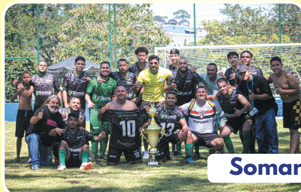
Somar x SBM