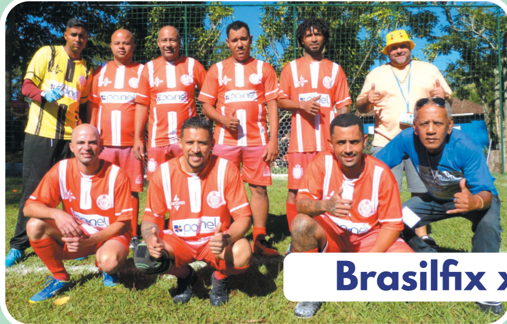
Brasilfix x Moschetti