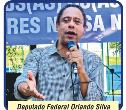
Deputado Federal Orlando Silva saúda a Diretoria do Sintrapel pela Inauguração do Espaço de Lazer

ORLANDO SILVA - DEPUTADO FEDERAL (PCDOB-SP)